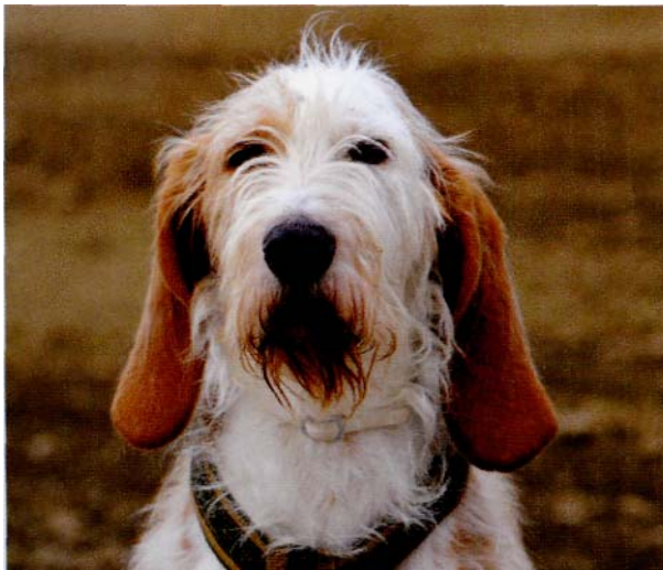
Verhält sich ein Hund eher ruhig und bedächtig, ist er nicht faul, sondern stabil und gefühlsbetont.

Ich selbst hatte eine ganz besondere Erfahrung mit Sheru - dem Himalaya-Schäferhund in unserem Haus im Himalaya. Wenn ich mich darauf vorbereitete, das Haus zu verlassen, beachtete Sheru mich normalerweise nicht. Üblicherweise versteckte er sich irgendwo, anstatt mich bis zum Tor zu be-