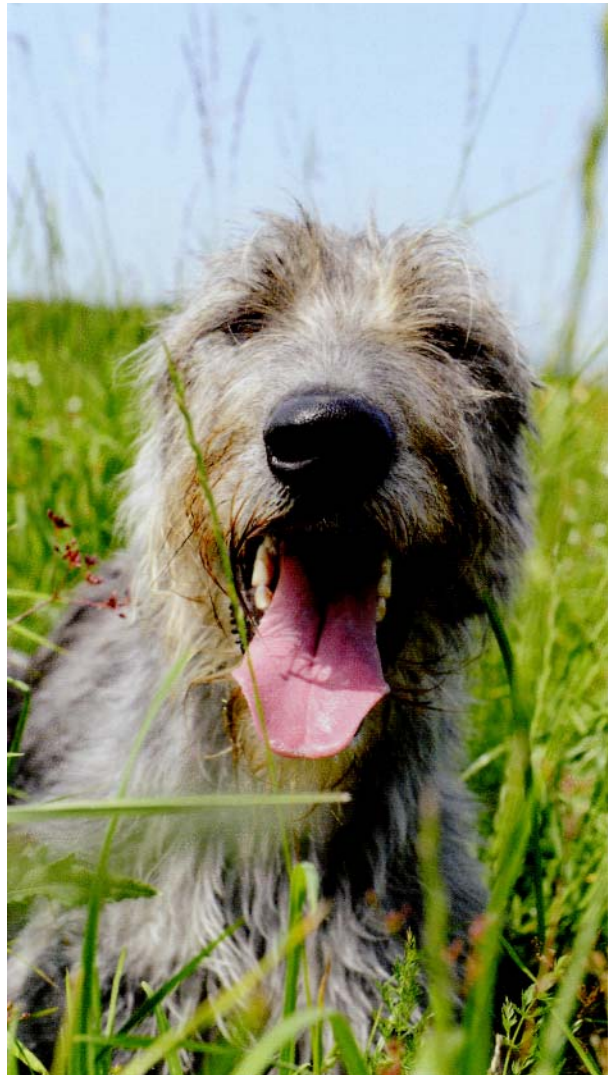
Mit einer abwechslungsreichen Diät wird ein Hund wieder fit.

Erhitzen Sie 1 Esslöffel Olivenöl oder Butter ( ghee ) in einem Topf und fügen Sie 1 Teelöffel Salz, 1 Teelöffel Kurkuma sowie je \frac{1}{2} Teelöffel Ajwain und Kressesamen hinzu. Geben Sie den Grieß hinein und rühren Sie alles etwa drei Minuten lang um. Geben Sie dreimal soviel Wasser wie Grieß in den Topf. Rühren Sie weiter und Sie werden sehen, dass der Grieß