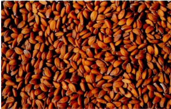
Kressesamen helfen bei der Regeneration des Verdauungssystems.

sollten jeden Tag eines der folgenden Rezepte zubereiten und diese Samen dazugeben. Die Samen sollten mit dem Essen gekocht werden, sonst wird der Hund sie nicht fressen. Während dieses Zwei-Wochen-Diätplans bekommt der Hund keinerlei Milch. Als Ersatz für tierische Fette sollte das Tier ghee (geklärte Butter), Butter oder Olivenöl bekommen.