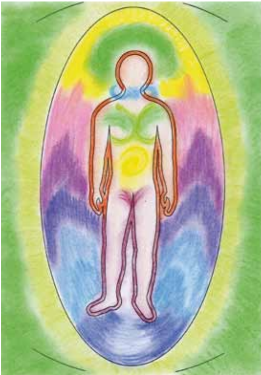
Abb. 46 Aura eines gesunden Menschen

Die Möglichkeit, dies mittels eines farbigen Auragrafs sichtbar zu machen, zählt für mich zu den Sternstunden der Heilkunst. Wir gehen selbstverständlich davon aus, dass der Simileffekt oder die Resonanz zwischen Person