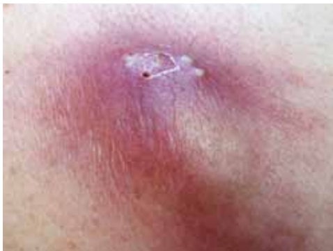
Abb. 45: Karbunkel

Durchmesser bis zu 13 cm oder mehr. Junge Personen oder solche mit robustem Naturell werden nur selten befallen. Beim Karbunkel treffen mehrere Furunkel und gangränöse Veränderungen aufeinander. Prädilektionsstellen sind die Haut entlang der Wirbelsäule, das Genick, inguinal und sternal. Karbunkel können bei abgemagerten und robusteren Menschen auftreten. Der Krankheitsverlauf steht meist mit großen Schmerzen in Verbindung.