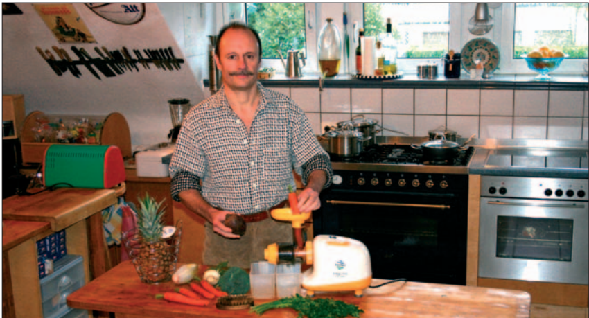
Der Autor in seiner Küche bei der Vorbereitung eines Gemüse- und Obstsaftes