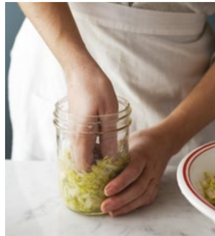
Den Kohl zusammenpressen