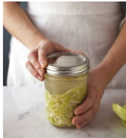
Das Glas verschließen und abwarten