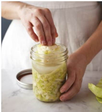
Mit dem Strunk beschweren