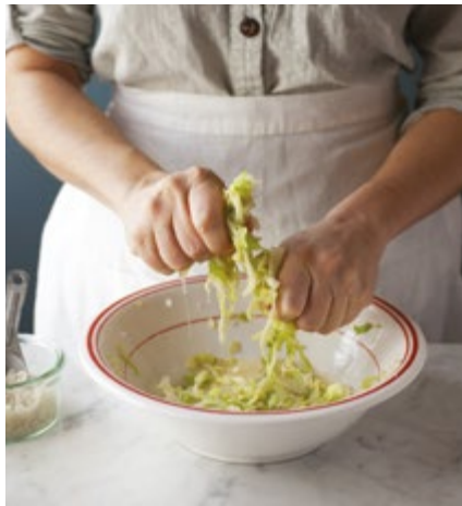
Weiterkneten, bis sich die Lake sammelt