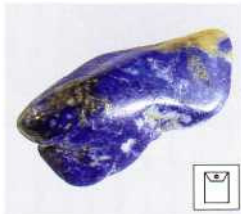
Lapislazuli ohne Pyrit

Zur allgemeinen Kühlung und Lymphflussverbesserung Chalcedon oder allgemeinen Opal als Wasser trinken, zur Blutdrucksenkung mit hellem Amethyst als Drusenstück und zusätzlich mit Halitkristall austreichen, Lapislazuli