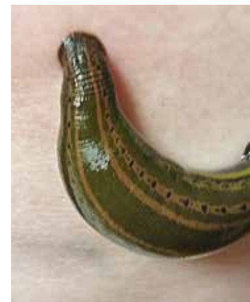
Saugender Hirudo medicinalis