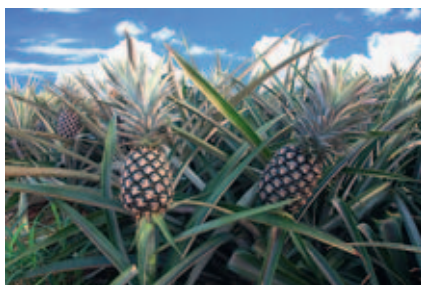
Abb. 2.34 Ananas ( Ananas comosus L. MERRILL) [J787]