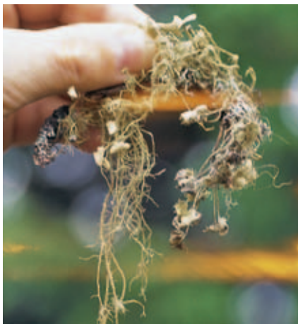
Abb. 2.16 Bartflechte (Usnea barbata L. WIGGERS emend. MOT., Usnea florida L. FRIES, Usnea hirta L. HOFFMANN, Usnea plicata L. FRIES) [M222]