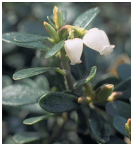
Abb. 2.15 Echte Bärentraube ( Arctostaphylos uva-ursi L. Sprengel) [V512]