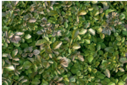
Abb. 2.35 Echte Brunnenkresse (Nasturtium officinale R. BROWN) [O562]

Darreichungsform: Zerkleinerte Droge, Frischpflanzenpresssaft sowie andere galeische Zubereitungen zum Einnehmen.