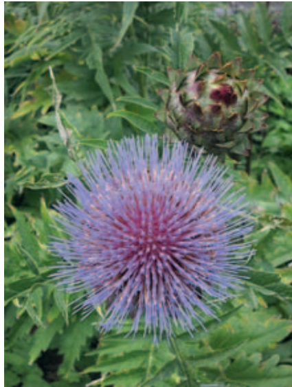
Abb. 2.11 Echte Artischocke ( Cynara scolymus L.) [0562]

Wirksamkeitsmitbestimmende Inhaltsstoffe: Bis 1,45 % Caffeoylchinasäurederivate (darunter Cynarin 0,02–0,7 %), bis zu 6 % Bitterstoffe (wie Cynaropikrin), 0,1–1 % Flavonoide (darunter Luteolin-7-glykosid, Scolymosid, Cynarosid). Das Cynarin ist ein Veresterungsprodukt, das bei der Aufbereitung der frischen Pflanze aus der 1,5-Di-caffeoylchinasäure entsteht, und ist vermutlich nicht der dominierende wirksamkeitsmitbestimmende Inhaltsstoff. Das Ph. Eur. verlangt vom Artischockenblättertrockenextrakt ( Cynarae folii extractum siccum ) einen Mindestgehalt von 0,6 % Chlorogensäure.