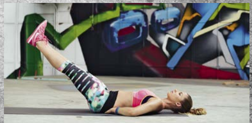
14. Leg Drop (siehe Seite 128) 20-mal