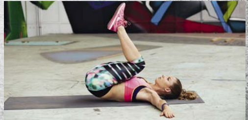
12. Reverse Crunch (siehe Seite 118) 20-mal