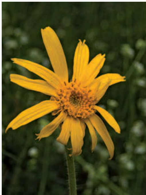
► Abb. 3.1 Arnica montana. Sie ist Wundheilerin ersten Ranges bei stumpfen Verletzungen, auch bei der durch Mikromuskeltraumen bedingten Achillodynie.

Auf elastische Schuhsohlen achten, sich z. B. mithilfe der Heileurythmie und/oder Physiotherapie einen weicheren Gang angewöhnen. Auf Naturboden Sport treiben.