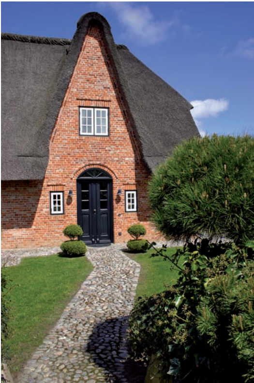
Abb. 30 Das Revier abschieiten

nern, die kein Revier zu sichern haben, die oft durch ein dominant weibliches Regiment eher zum „Hausinventar“ degenerieren, sind hausgemacht. Hier ist Aufklärung dringend nötig. Auch der alte Mann braucht ein Revier, das er sichern und markieren kann. Das wirkt sich positiv auf seine Gesundheit, aber auch auf seine Partnerin, Kinder und Enkel aus. Die Sicherheit, die von einem Mann ausgeht, nimmt die Außenwelt instinktiv wahr, denn es geht um althirngesteuerte Botschaften von Naturgesetzen. Da können wir so modern sein, wie wir wollen. Das Revier des Mannes ist klar begrenzt und definiert. Eine Übung, die ich vielen kranken Patienten verordnet habe, hat mehr Heilung bewirkt als Arzneien: