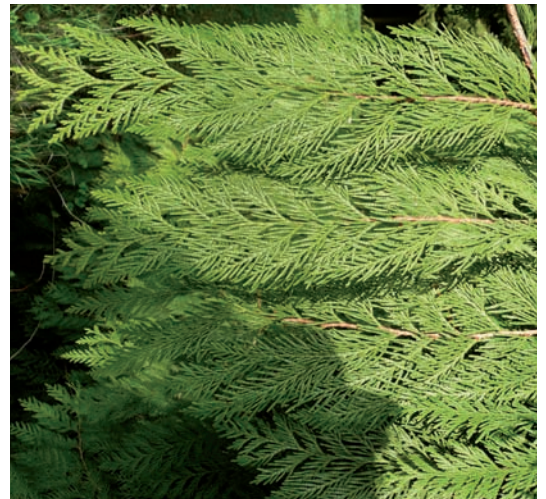
Abb. 11 Thuja plicata

In der miasmatischen Therapie ist ohnehin Thuja das die gesamte Sykose ergreifende Hauptmittel und bringt alles an den Tag, das im Verborgenen liegt. Thuja ist der Lebensbaum und daher das wichtigste Sinnbild für Heilung. Chronische Frauenkrankheiten sind entweder in der Sykose angesiedelt (harnsaure, lithämische Diathese) oder sind von der Sykose noch tiefer in den Organismus auf die destruktive Ebene der Syphilinie oder Karzinogenie gesunken. In jedem Falle ist die Ausheilung der Sykose oberstes Gebot, damit keine Rückfälle entstehen und der nötige Raum zur Konfliktlösung geboten wird. Die Sykose besteht aus den Elementen Wasser und Erde, die zusammen fruchtbaren Humus in der wirklichen Natur und im übertragenen Sinne in der Frau anregen. Alles kommt ins Fließen, so auch das Fühlen, Weinen, Menstruieren oder jenseits der Menses das Gefühl für Lebensrhythmus. In der Sykose-Schicht der Krankheit stehen nicht mehr die biologischen Heilungsversuche des Organismus im