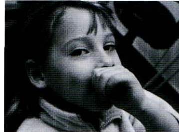
Abb. 92 Lutschoffener Biss beim Kind

Was bedeutet es denn, wenn ein Kind am Daumen lutscht?